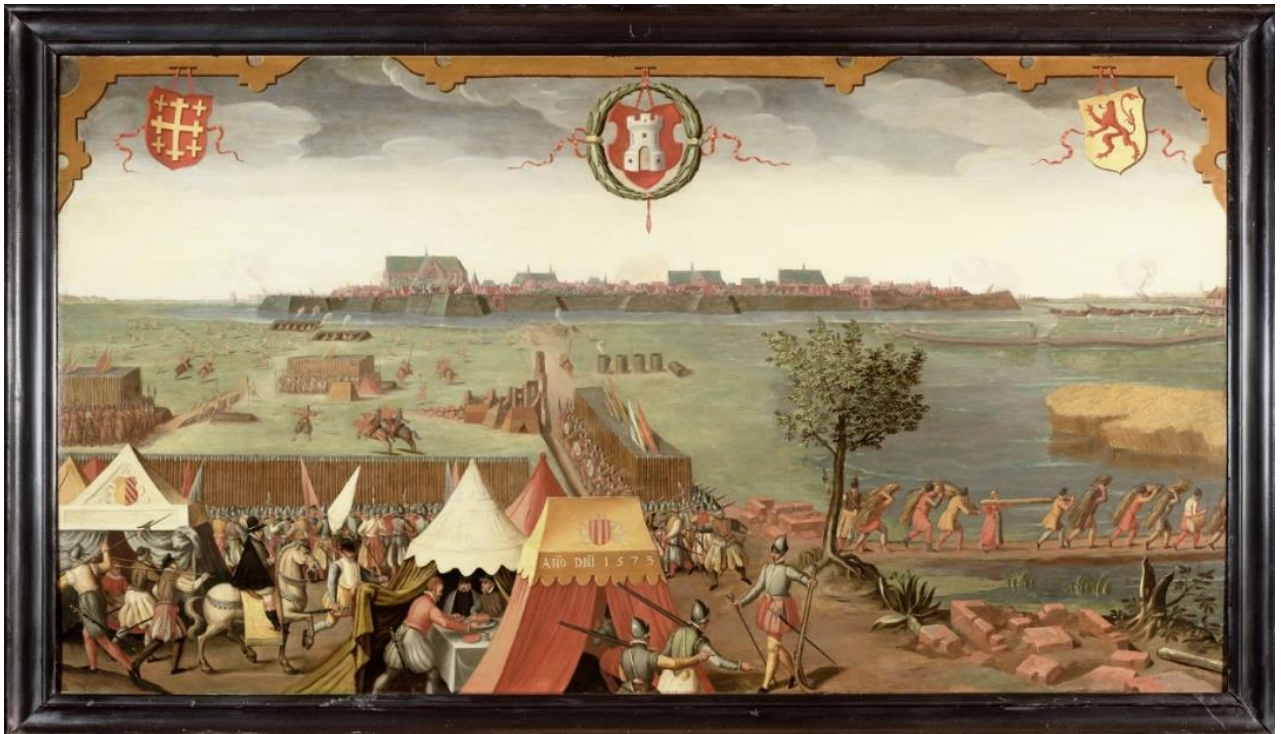
Bron 1 Het beleg van Alkmaar gezien vanuit het zuiden. Geschilderd door Pieter Adriaensz Cluyt in 1580.

Stel, je gaat onderzoek doen naar het beleg van Alkmaar in 1573 en je vindt deze twee bronnen: