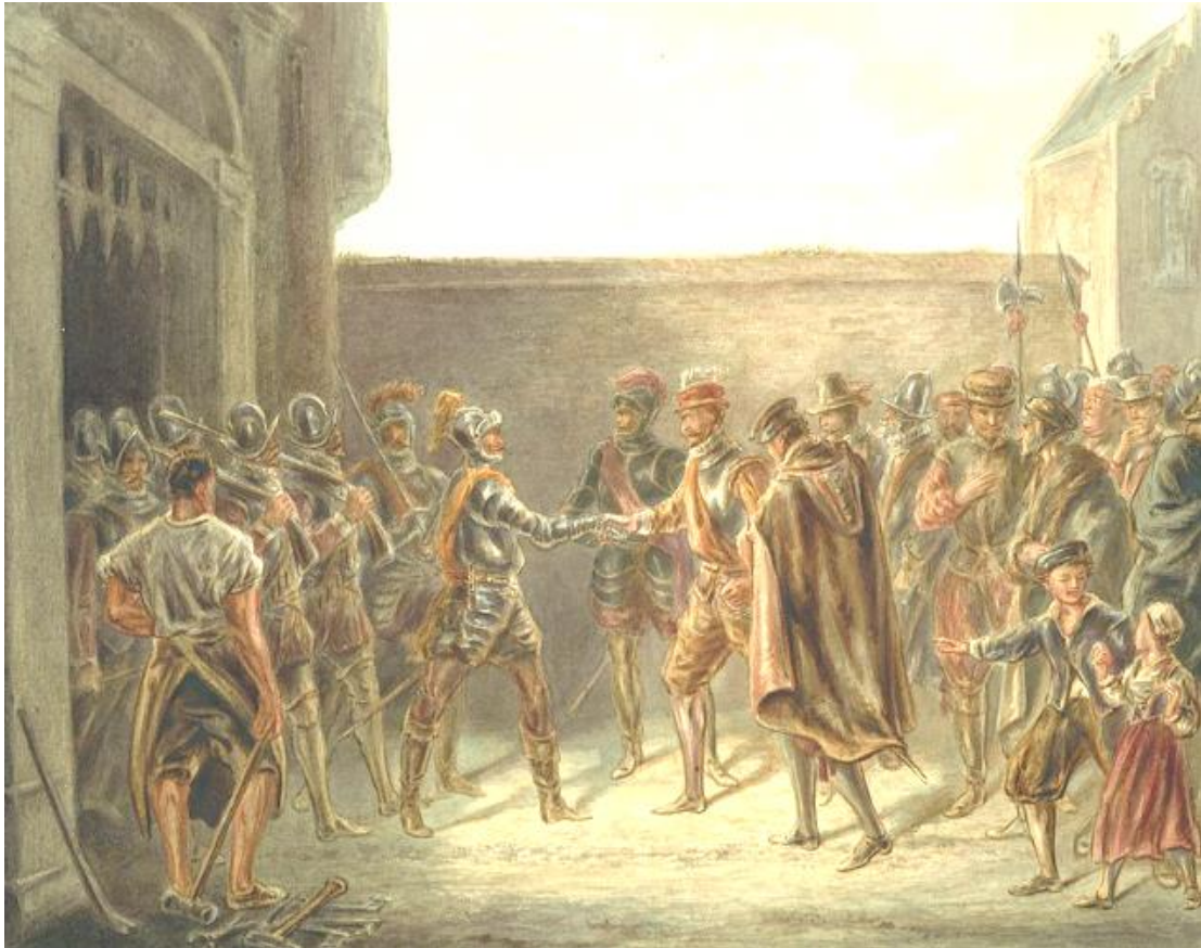
Bron 6 Oranjes krijgsvolk komt Alkmaar binnen, 16 juli. Afbeelding gemaakt door Alexander Ver Huell, 1872.

Ondersteun beide conclusies met een verwijzing naar de bron